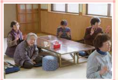
※掲載写真は過去(新型コロナウイルス感染拡大前)に撮影されたものです。