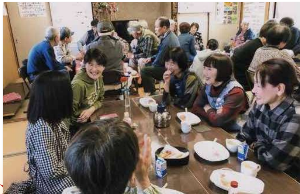
※掲載写真は過去（新型コロナウイルス感染拡大前）に撮影されたものです。

時折、差し入れも頂き、話題が豊かになりました。新型コロナウイルス感染拡大で、活動は一時中断しましたが、再開に向けて喫茶活動をより良くする為の検討をする時間と捉えて、様々なアイデアを出し合って切磋琢磨しています。遊友会の更なる発展に繋がるように、今後も活動を続けていきたいです。