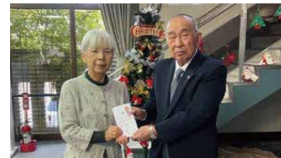
養老町赤十字奉仕団さま 養老町社会福祉協議会へ 50,000円

次の方々より善意のご寄付をいただきました。趣旨に添って、有効に活用させていただきます。ありがとうございました。